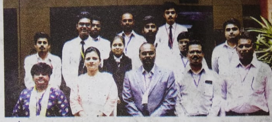
इरिडिसेंट स्मार्ट, इंडिया हॅकेथॉन स्पर्धेसाठी निवड झालेला अमृतवाहिनी अभियांत्रिकी महाविद्यालयाचा संघ.

यावर्षीच्या हॅकेथॉनमध्ये स्मार्ट कम्युनिकेशन, हेल्थकेअर आणि बायोमॅडिकल सर्व्हिसेस, अग्रीकल्चर आणि रुरल डेव्हलपमेंट, स्मार्ट व्हेईकल, फूड टेक्नॉलॉजी, रोबोटिक्स, वेस्ट मॅनेजमेंट, क्लिन वॉटर, रिनिवेल एनर्जी आदी विषय मांडण्यात आले होते. नगर जिल्ह्यामधील एकमेव अमृतवाहिनी अभियांत्रिकी महाविद्यालयाचा संघ इरिडिसेंट स्मार्ट इंडिया हॅकेथॉन-२०१९ या स्पर्धेसाठी निवडला गेला असून पश्चिम बंगालमधील I.I.T. खरगपूर या ठिकाणी दिनांक- २